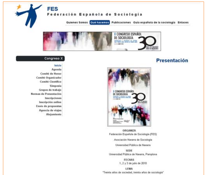
Portada de la página web del X Congreso Español de Sociología

Más info: http://www.fes-web.org/que-hacemos/congresos/X/