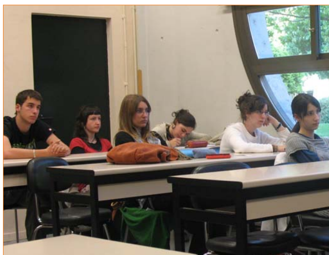
Algunos de los alumnos asistentes a la charla

Finalmente su empresa no pudo seguir adelante, erraron en el nicho de mercado, pero todas las decisiones tiene aspectos positivos y les permitió aprender sobre multi-