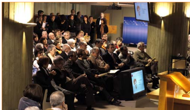
Al acto acudieron multitud de amigos y familiares de la premiada.

Durante 8 años, la misionera dominica ejerció su labor en la selva del norte de la R.D. del Congo con los pigmeos, colaborando en actividades y proyectos en los ámbitos de la salud, la educación, la agricultura y la alfabetización.