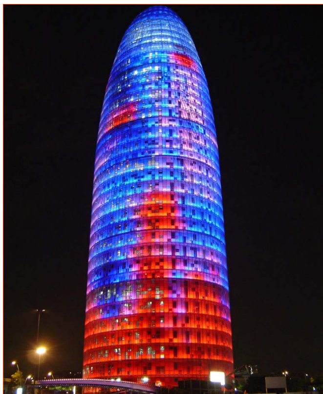
Torre Agbar en Barcelona

Por último, se organizaron cuatro sesiones especiales que, por sus características particulares, rompían un tanto el modelo de actos hasta ahora expuesto. En ese contexto tuvo lugar una conferencia de Manuel Castells así como un debate sobre el futuro cercano de la socio-