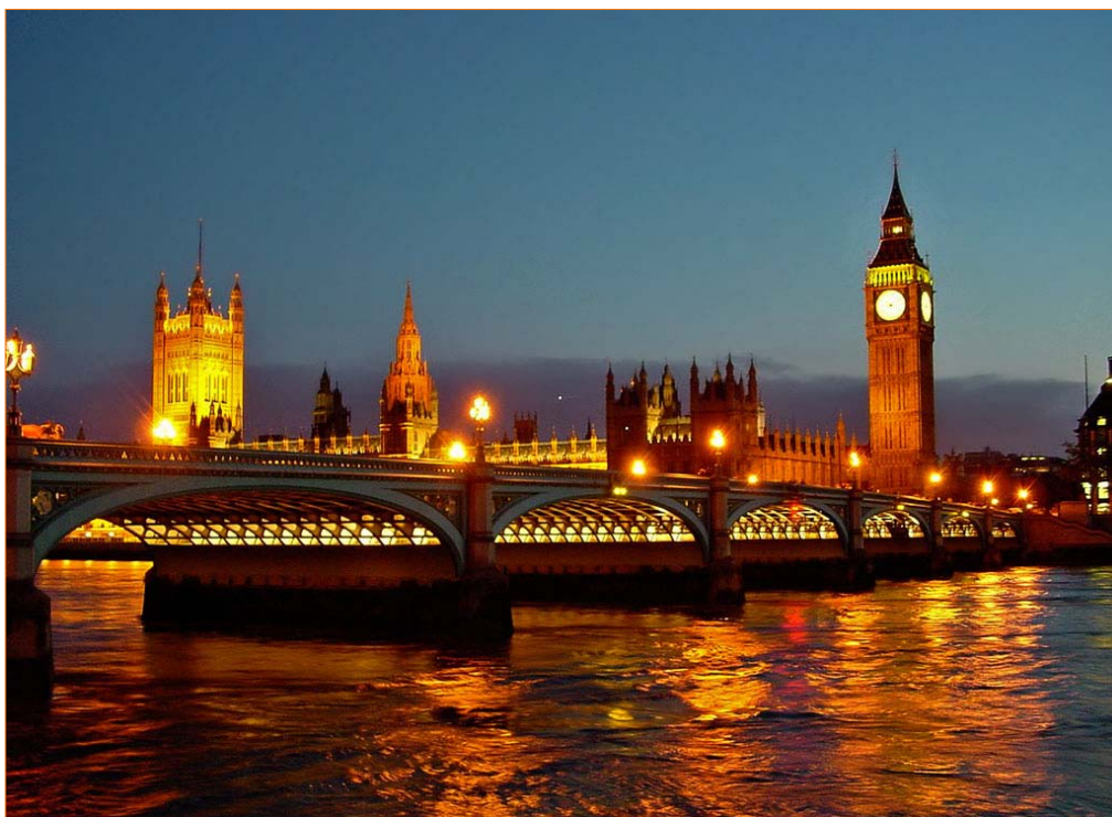
Imagen de Londres.

Participé en el Master de atención al medio dando clases de demografía e investigación. Como he trabajado muchos años en salud mental conozco el tema de la prevención. Como nota curiosa las dos únicas sociedades científicas a las que he pertenecido son la AEN (Asociación Española de Neuropsiquiatría y Asociación Española de