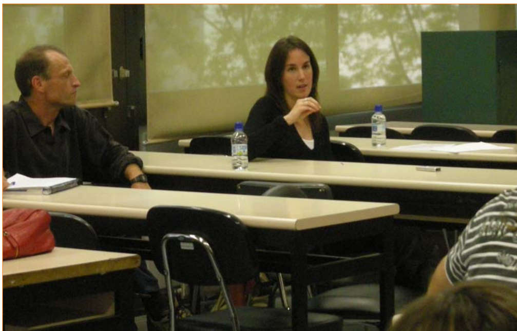
La charla se desarrolló en un ambiente distendido

- Cuando se lanza el proyecto, la gente que plantea la idea de indicadores no sabe muy bien qué es, pero estaba