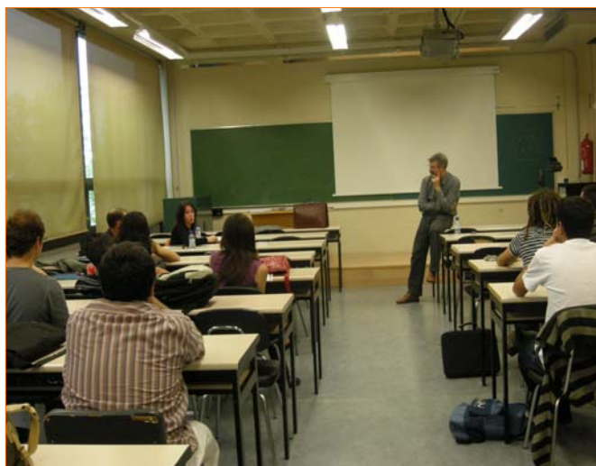
La charla se celebró en el aula de la UPNA

todo. Después empecé a trabajar de becaria. Comentaros que el trabajo de becaria surge a partir de la bolsa de empleo de la Universidad; es importante estar apuntada en bolsas de empleo, ya sea esa, ya sea la del Servicio Navarro de Empleo, la de FOREM, la del Colegio de Sociólogos, o donde sea... El trabajo surge de ahí. No sé si me cogieron por la titulación de Sociología pero era un poco también para hacer encuestas. A lo que voy es que, de primeras, no te van a coger de "socióloga" para hacer una investigación, pero que no desechéis todo lo os pueda surgir alrededor. Estuve como año y medio en