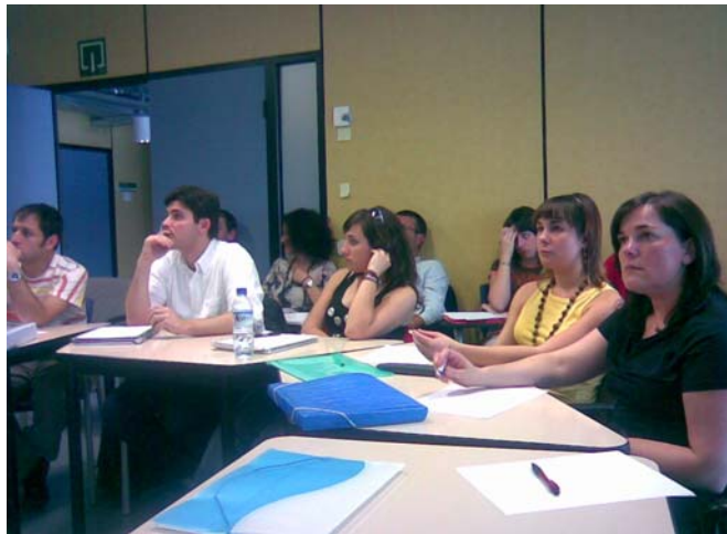
Algunos de los asistentes de la sesión.