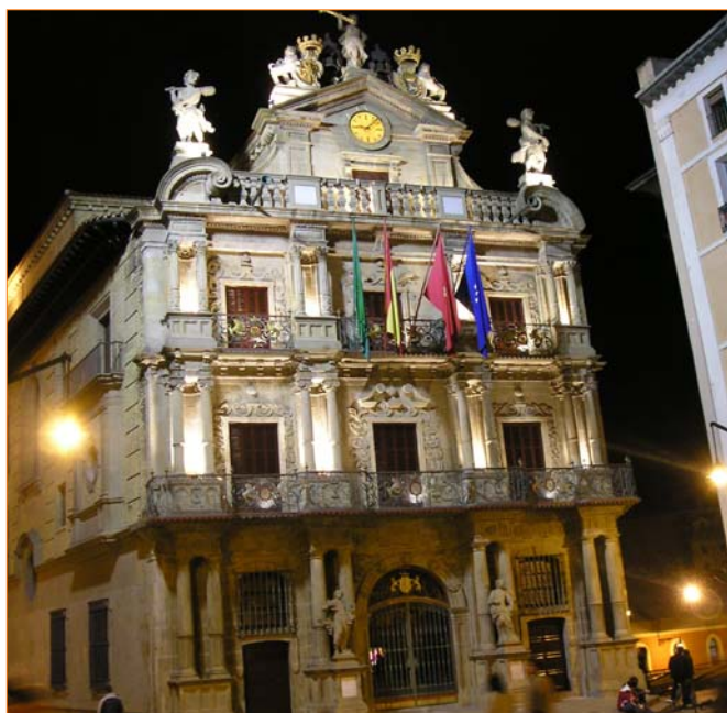
Ayuntamiento de Pamplona

Navarra en cuanto a proporcionar a sus administrados un modo de vida adecuado y satisfactorio, por otro. El instrumento de medida desarrollado en la tesis va más allá de los indicadores de mera orientación económica y del concepto y la metodología de los indicadores sociales objetivos; representa una herramienta para el control del bienestar, control entendido no en el sentido peyorativo sino en cuanto a conocer y medir para actuar en positivo en aquellos ámbitos de la vida social (renta, trabajo, salud, educación, familia, relaciones sociales, vivienda, entorno urbano, ocio y tiem-