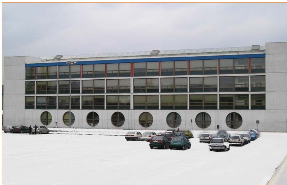
Edificio del Aulario de la Universidad Pública de Navarra