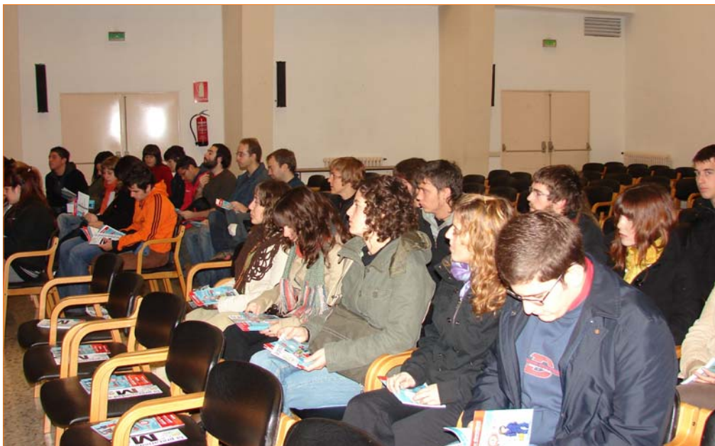
Estudiantes de Sociología de la UPNA que participaron en la visita guiada organizada por CC.OO.

Después nos dirigimos al Centro Integrado FOREM, Centro de Formación y Empleo de CC.OO en Navarra. En la primera parte de la visita, una orientadora hizo una pequeña exposición de los recursos que podían encontrar en el centro, además de informarles de las diferentes salidas profesionales y posibilidades de especialización que tenían a su alcance los estudiantes de sociología, una vez hubiesen terminados sus estudios. A continuación se visitó las instalaciones de FOREM.