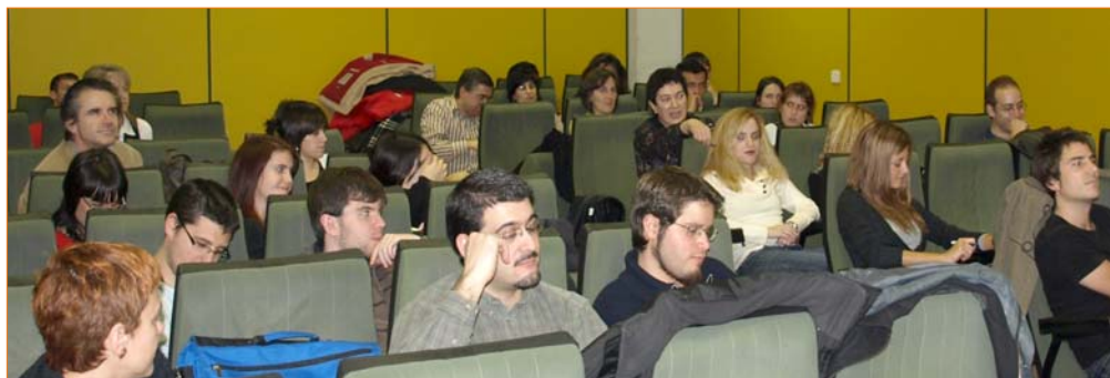
Personas que acudieron a la jornada en la sala Nicolas Oresmes de la UPNA