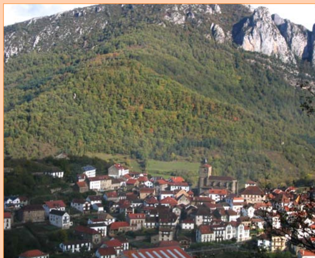
Una vista aérea de Isaba

Lejos de una economía autárquica, la integración y la interdependencia son dos pilares esenciales en las economías locales de los valles. Una causa y efecto de la integración en una economía globalizada es la identificación y puesta en valor del carácter singular del territorio. La configuración ideológica postmoderna confiere a estos valles su carácter simbólico y subraya sus atributos de naturalidad, rusticidad y etnicidad que serán trasladados a sus productos. La economía de signos favorece la diferenciación territorial y simbólica del territorio y potencia las actividades agropecuarias tradicionales desarrolladas bajo criterios