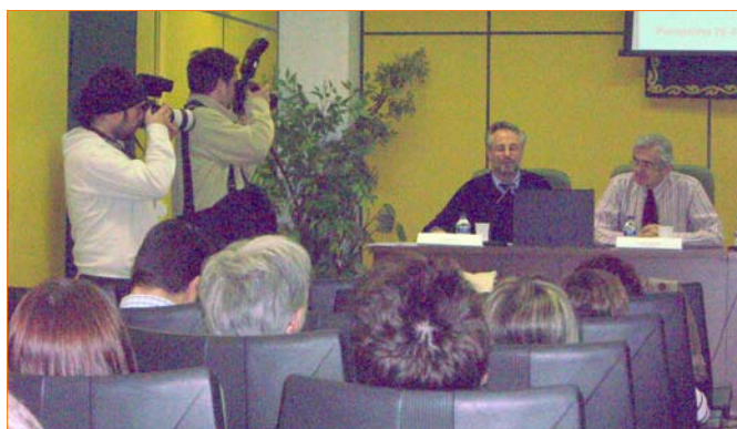
Algunos medios que acudieron al acto.

Hoy en día estamos testando en los grupos de discusión no sólo el eslogan de la campaña sino incluso los logos, qué