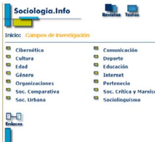
Portada de Sociologia.org

Dirección: http://www.sociologia.org/indesd.php