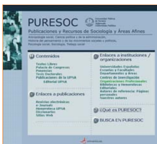
Portada de Puresoc

Dirección: http://www.unavarra.es/puresoc/